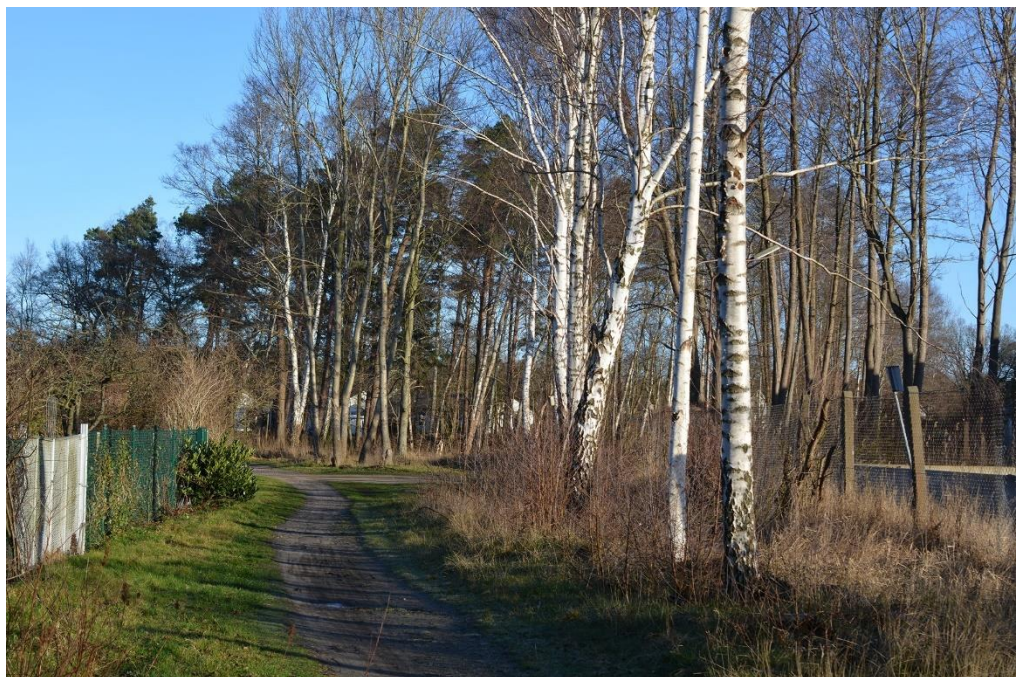
Figur 5. Klena björkar längs stigen i objekt 2.