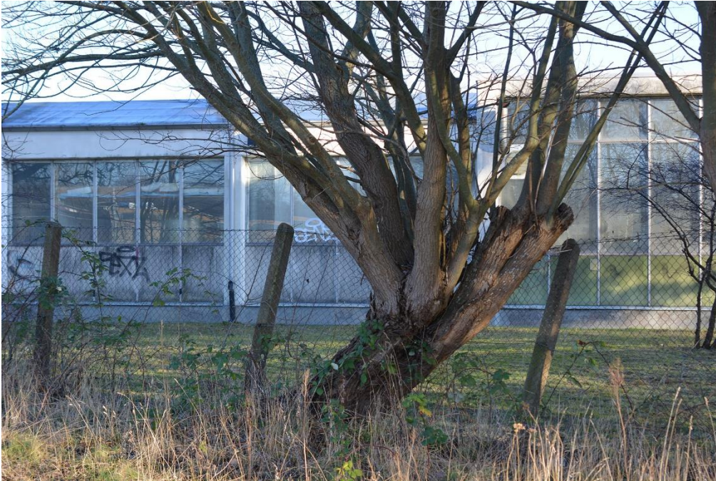
Figur 6. Sälg i objekt 3.

Objektet bedöms ha ett visst biotopvärde och ett lågt artvärde. Area: 0,11 ha.