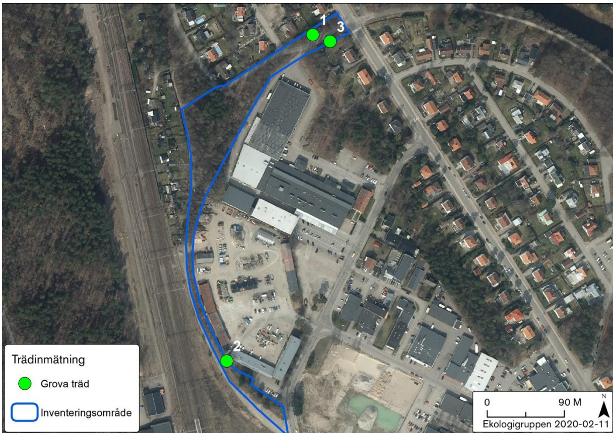
Figur 8. Grova träd (gröna punkter) i och i anslutning till inventeringsområdet.