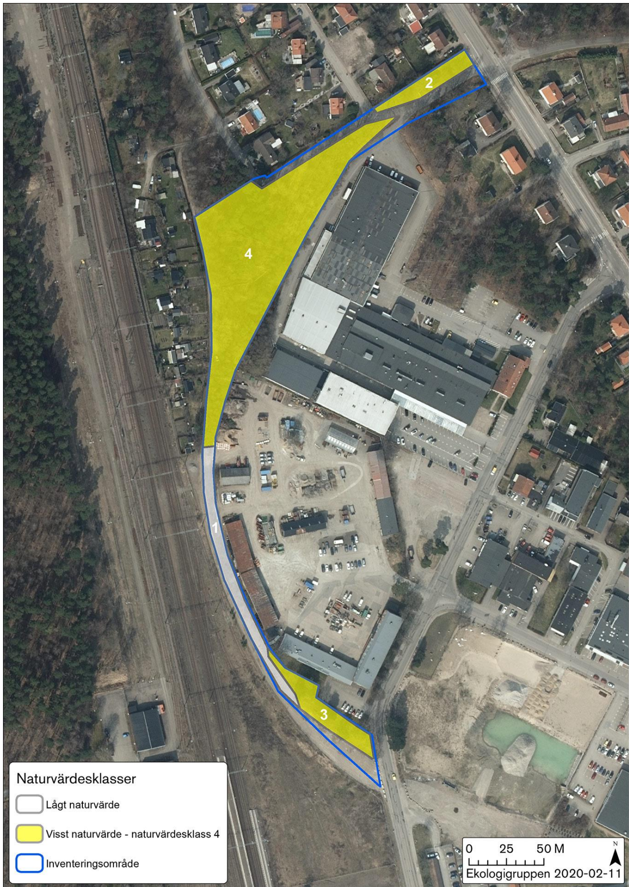
Figur 3. Karta med naturvärdesobjekt inom inventeringsområdet.