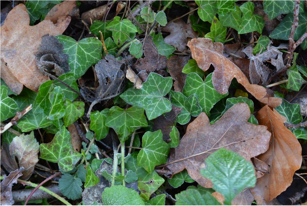
Figur 7. Murg gröna i objekt 2.