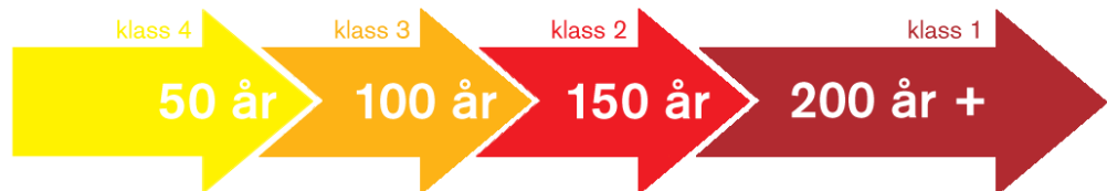
Figur 10. Schematisk beskrivning av hur miljöns kontinuitet över tid och naturvärde kan hänga ihop.

Värdefulla och grova träd som finns inom utredningsområdet utgör en viktig bas för den nya/tillkommande grönstrukturen om delar av området i ett senare skede skulle bebyggas. Lägre naturvärden som går förlorade vid en eventuell bebyggelse kan kompenseras för genom att skapa nya, likartade naturmiljöer i den nya miljön eller i intilliggande områden. Högre naturvärden, särskilt sådana värden som är knutna till exempelvis gamla träd och skogsmiljöer med lång kontinuitet går som regel inte att återskapa eller kompensera för och bör inte bebyggas. Dessa miljöer är mycket känsliga för ingrepp och uppkommen skada på naturvärdena bedöms vara irreversibel.