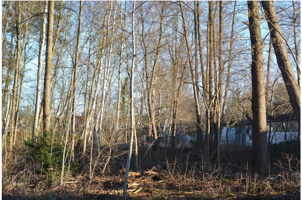
Figur 4. Mellersta delen av objekt 2 består främst av trivallöv och tall.

Objektet bedöms ha ett visst biotopvärde och ett lågt artvärde. Area: 0,81 ha.