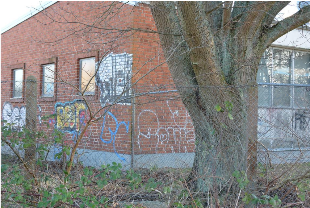
Figur 9. Grov ek i objekt 3 (träd 2 på kartan ovan).