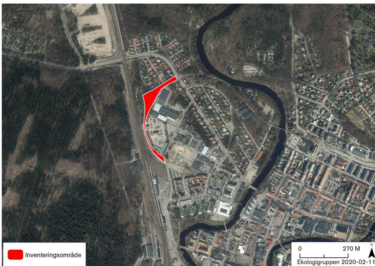
Figur 1. Inventeringsområdets läge norr om Ängelholms tågstation (röd polygon).

Lars Salomon har varit ansvarig för inventering och rapportskrivning. Uppdraget har genomförts under februari månad 2020.