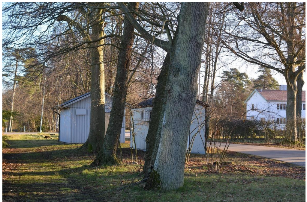
Figur 2. Ek, klibbal och bok i objekt 1.

Objektet bedöms ha ett visst biotopvärde och ett lågt artvärde. Area: 740 m 2 .