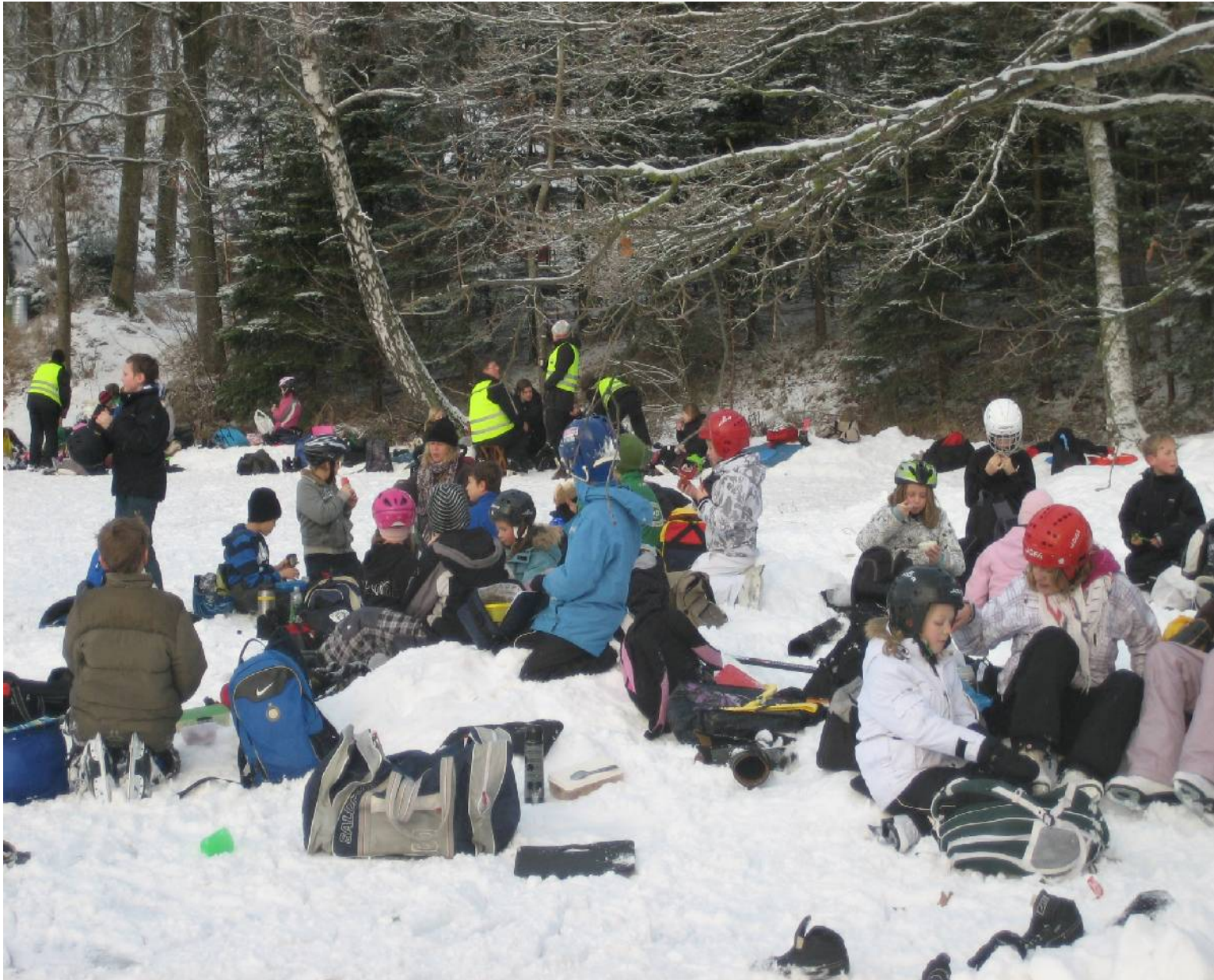
Lite fika- och pratpaus.