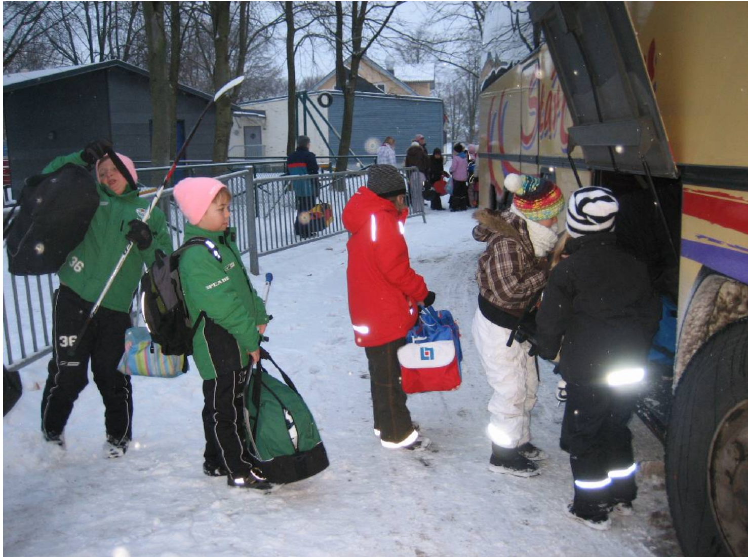
Bussen ska packas med matsäck och utrustning.