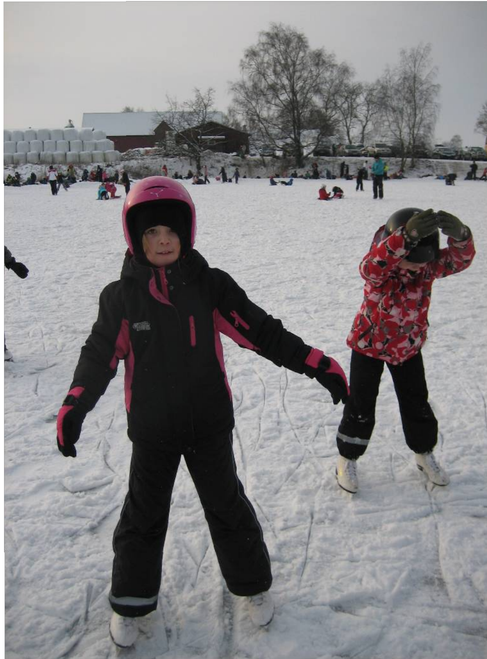
Några tränar piruetter .....