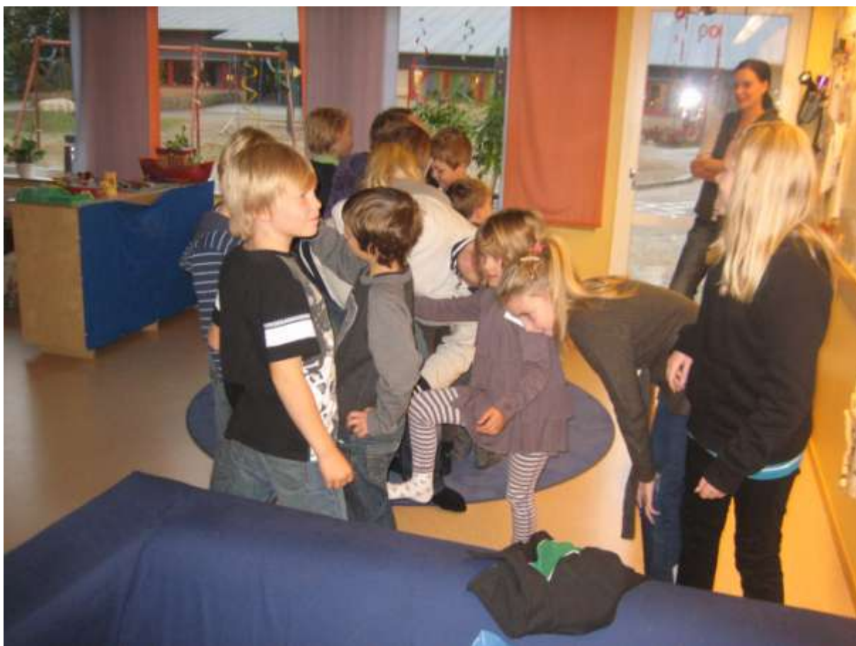
i en mänsklig staty är det fart och fläkt!