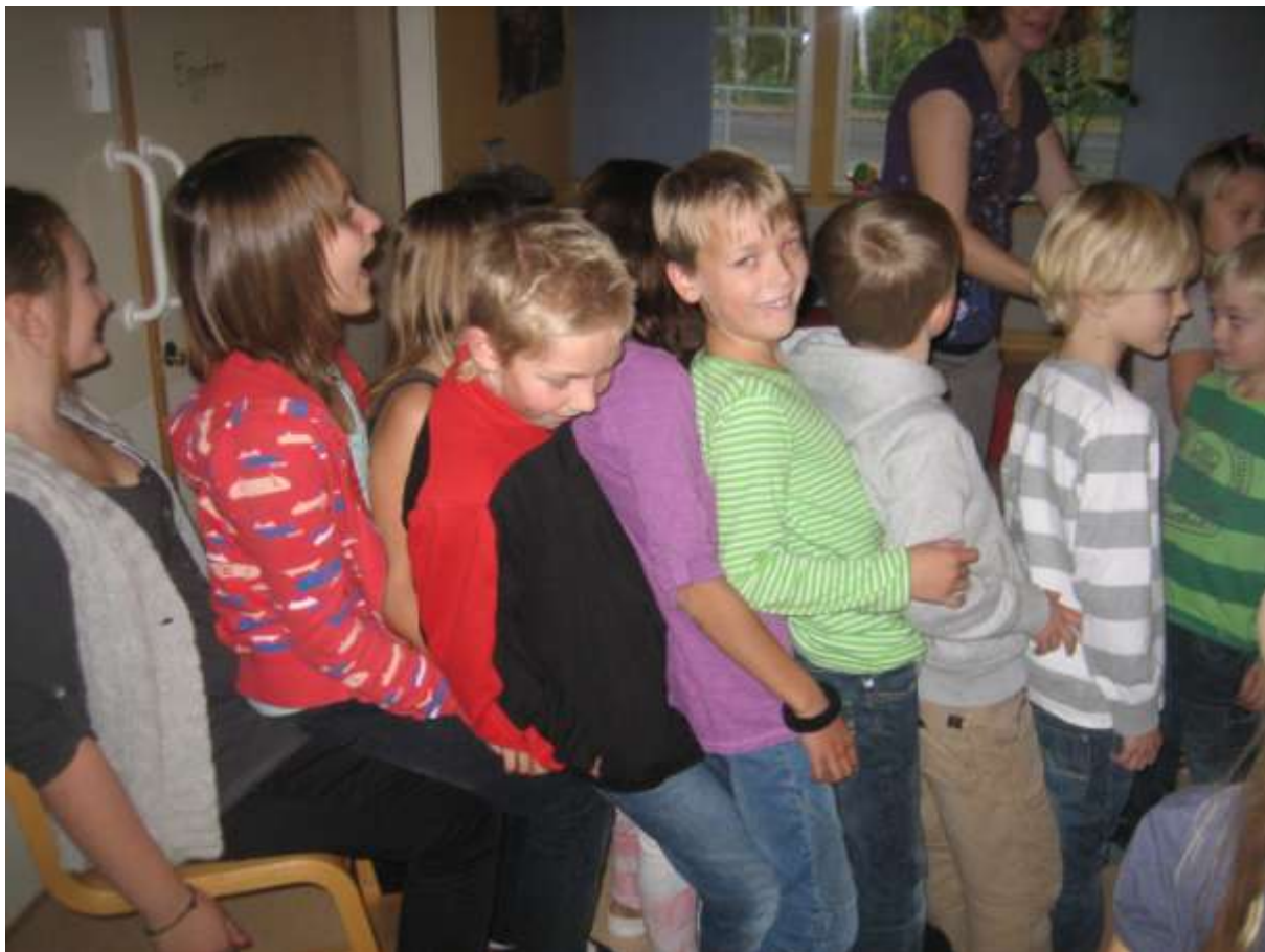
Att sitta många på en stol, går helt perfekt...