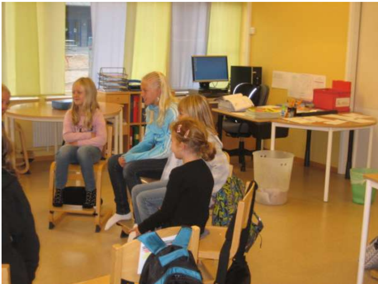
Man får lyssna och sitta still...