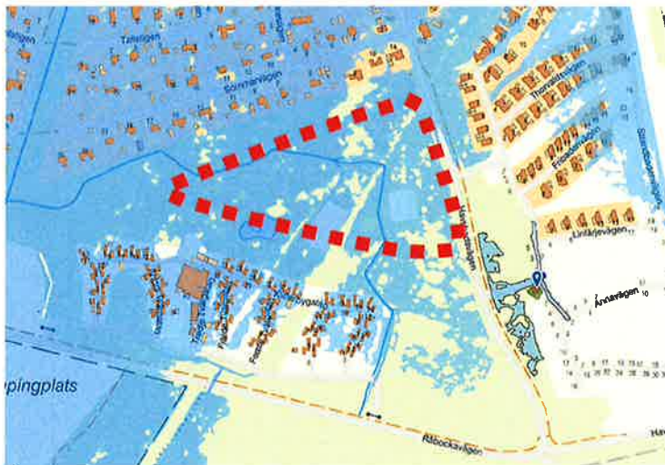
Översvämning i det aktuella området vid en högvattennivå på +3,5 m.

De befintliga sanddynorna som idag skyddar stadsdelen Havsbaden klassas som SGU som strand med betydande erosion. Ett utredningsarbete pågår för att titta på förstärkningsåtgärder för att säkerställa sanddynornas funktion som skydd mot höga havsnivåer för en lång framtid.