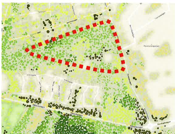
Överblick över områdets skogstyper. Området domineras av trivallövskog med inslag av ädellövskog, tallskog och lövblandad barrskog. (stadstrad.se)

Området som ansökan avser består idag av skogbevuxen naturmark. Idag används området som rekreationsområde. Genom området går ett antal anlagda naturstigar och i den nordvästra delen finns en bollplan. Vegetationen är en blandning av barr- och lövträd och består till största del av tall och björk. Inom området finns det sannolikt en del äldre träd. Mycket gamla träd hyser ofta höga naturvärden och ha stor betydelse för den biologiska mångfalden.