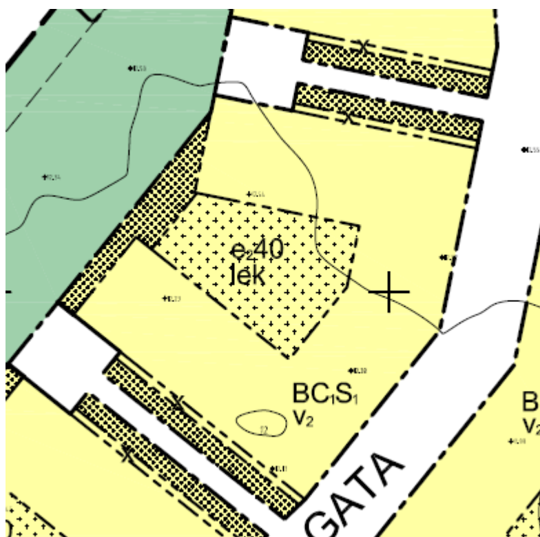
Utklipp ur gällande detaljplan - Detaljplan för Ängelholm 5:16, 5:46 m.fl. Fridhem, DP 1085 .

För området gäller Detaljplan för Ängelholm 5:16, 5:46 m.fl. Fridhem, DP 1085 . Gällande detaljplan medger byggnation av flerbostadshus med möjlighet till centrumändmål i bottenvåning. Högsta byggnadshöjd uppgår till 17 meter (nockhöjd 21 meter), se bilaga 2 för fullständiga planhandlingar.