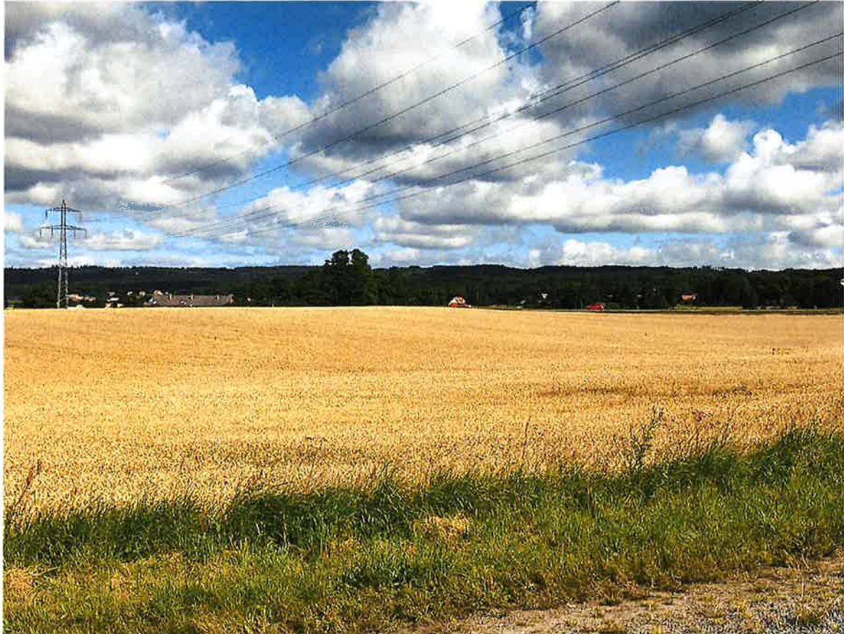
Området sett från söder med Hallandsåsen i horisonten.

Exploatering av ett nytt större verksamhetsområde med en bebyggelsehöjd om minst 15 meter kommer med stor sannolikhet påverka landskapsbilden. Exploateringen kommer troligtvis vara synlig på långt avstånd och bli ett nytt och till viss del främmande inslag i området. Landskapsbildens påverkan samt eventuella åtgärder för att anpassa bebyggelsen till den befintliga miljön bör därför utredas som en del av detaljplanarbetet.