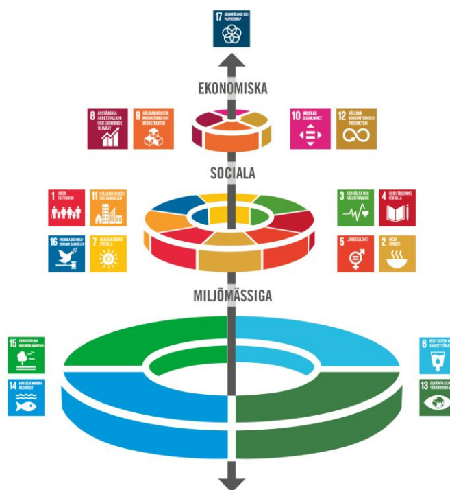
Figur 2. Skiss över de globala målen uppdelade i de tre dimensionerna, ekologisk, social och ekonomisk hållbarhet.

Den ekologiska hållbarheten, även kallad den miljömässiga, kan ses som grundpelaren för de andra dimensionerna och sätter ramarna genom ekosystemets planetära gränser. Den sociala hållbarheten pekar ut dimensioner för rättvisa, trygga och välmående samhällen som i sin tur ger förutsättningar för att nå målen i den ekonomiska dimensionen. Målen är integrerade och odelbara vilket innebär att inget mål kan nås på bekostnad av ett annat.