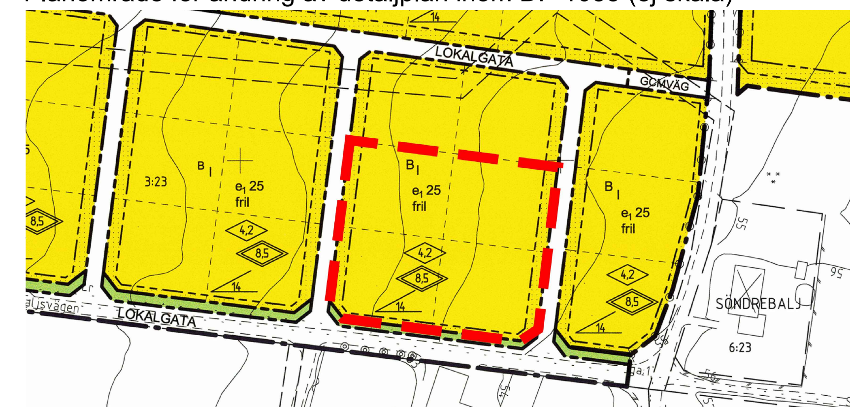
Planområde för ändring av detaljplan inom DP 1035 (ej skala)