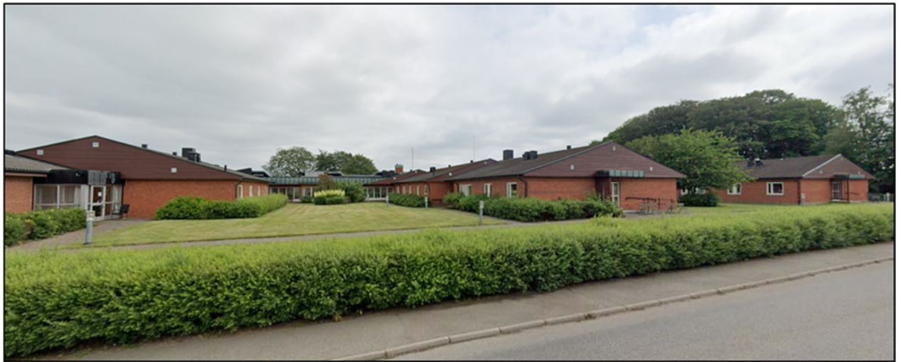
Befintlig bebyggelse som föreslås rivas.

Utifrån hållbarhetsaspekter, miljöplan och miljömål bedöms förslaget positivt då det medför en mer resurseffektiv markanvändning och mer blandad bebyggelse i kollektivtrafiknära läge.